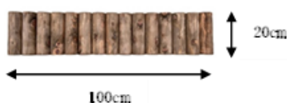
丸太花壇ブロック H20cm×W100cm