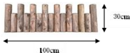
丸太花壇ブロック(凹凸) H30cm×W100cm