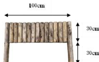
丸太花壇ブロック H60cm×W100cm