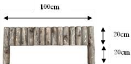
丸太花壇ブロック H40cm×W100cm