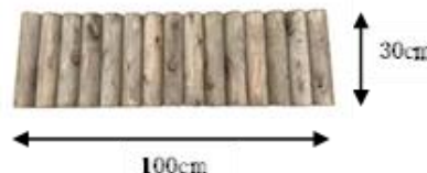
丸太花壇ブロック H30cm×W100cm